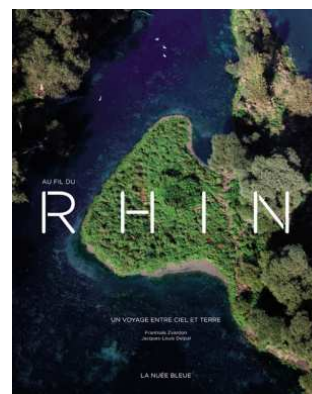
AU FIL DU RHIN. Ed. La Nuée Bleue. Textes Jacques-Louis Delpal. Photos de Frantisek Zvardon