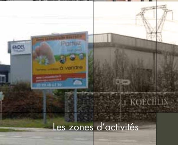
Les zones d'activités

Voilà plus de 40 ans que la communauté de communes Essor du Rhin (CCER), autrefois SIVOM puis District, s'est constituée. Elle se compose aujourd'hui de 7 communes et compte 9 271 habitants.