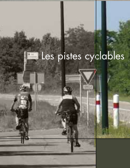
Les pistes cyclables