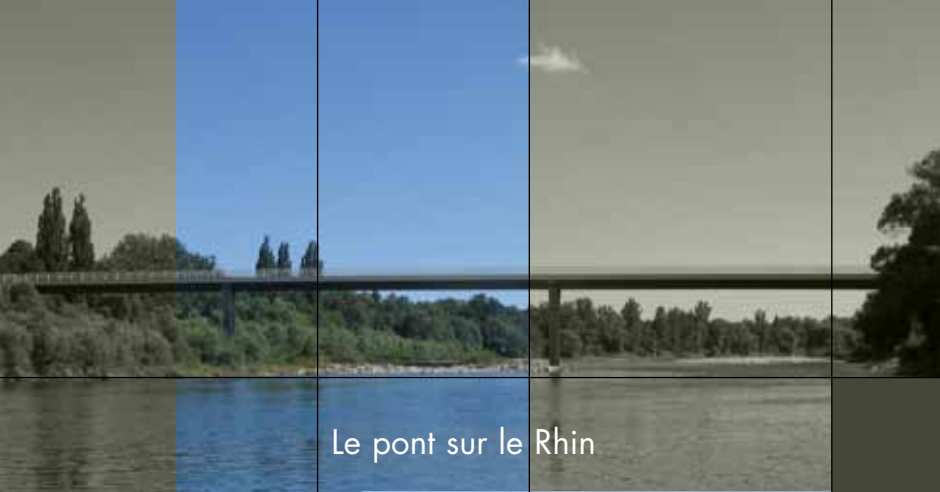
Le pont sur le Rhin